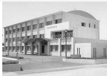
徳島県国民健康保険団体連合会

上限の管理を行います。言い換えれば、サービス事業者から提出される請求書もカット又は返送されるわけです。 このように大変重要な位置にある皆さんは、常に受給者（家族等）、サービス事業者、医療関係者、市町村等と連絡を密にしながら給付管理票等関係書類の作成をお願いしたいと思います。 五月サービス提供、五月請求分を処理する中で気がついたことをいくつか記します。